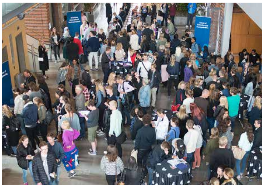
Mer än 350 personer tog chansen att lära känna Jönköping University innan studierna drar igång.