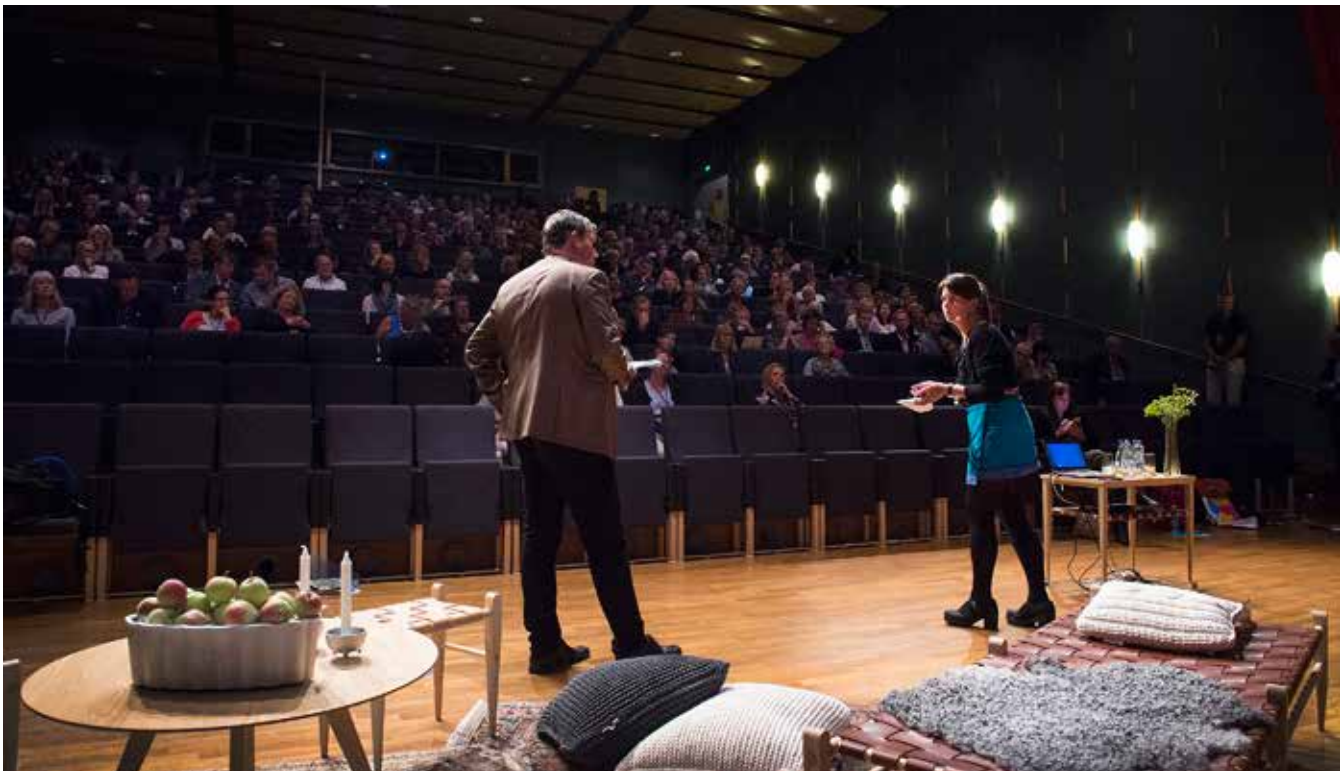
Konferensen 250 möjligheter anordnas av Jönköping University, Vertikals, Sparbanksstiftelsen Alfa, Region Jönköpings län, Fastighetsägarna, LRF, Länsstyrelsen i Jönköpings län och Destination Jönköping i samarbete med SmåKom, härifrån och Jordbruksverket.

Det startade med ett blogginlägg 2013 och nu till hösten väntas flera hundra personer komma till Jönköping University för att delta i konferensen 250 möjligheter.