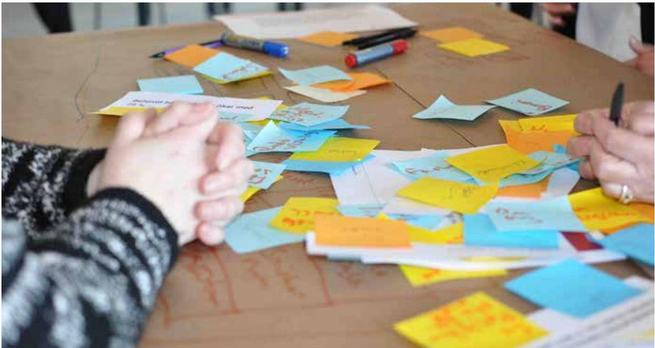
Ett hackathon under en kväll genererade över 100 nya idéer.

Efter en tids arbete med Gerotech dök det upp en möjlighet att delta i det Vinnovafinansierade projektet CARENA (Collaboration Arena), där flera lärosäten samarbetade för att synliggöra och utbyta erfarenheter kring samverkan. JU var ett av dessa, och Gerotech valdes som case. En styrgrupp sattes samman för projektet, med representanter från Science Park, Almi, Qulturum (Region Jönköpings län) och andra aktörer på marknaden, för att kunna ta projektet vidare.